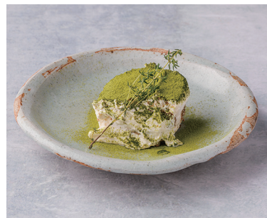
Tiramisu with Onoen Dark-Roasted Green Tea